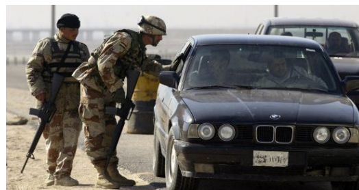
Punto de control cerca del campo petrolífero de Rumaila.