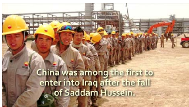
China was among the first to enter into Iraq after the fall of Saddam Hussein.

China National Petroleum Corporation (CNPC) es una de las compañías petroleras internacionales que operan en Irak después de la guerra en circunstancias difíciles. La compañía ha contribuido significativamente a que el país se una a la Iniciativa para la Transparencia de las Industrias Extractivas (EITI) al participar en el grupo de múltiples partes interesadas (multi-stakeholder group) de EITI.