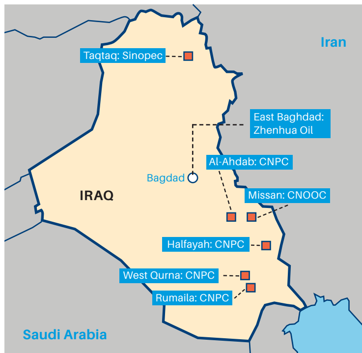
Compañías petroleras chinas y campos petrolíferos en Iraq