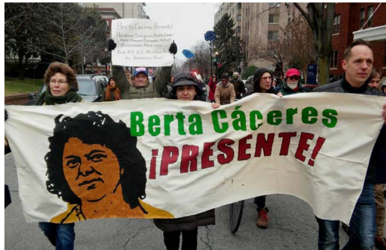
Protestas internacionales tras el asesinato de Berta Cáceres