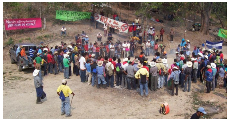
Miembros de la comunidad de Rio Blanco bloqueando el camino de acceso al sitio del proyecto.

El proyecto ha sido rodeado por conflicto social y violencia significativa. Después de que un miembro de la oposición local fuera asesinado durante una protesta pacífica, Sinohydro se retiró del proyecto. El proyecto recibió atención internacional cuando la líder local indígena Berta Cáceres ganó el prestigioso Premio Ambiental Goldman por su liderazgo en la resistencia contra la presa en 2015. En marzo de 2016, Berta Cáceres fue asesinada en su casa por hombres con vínculos con la compañía de construcción local. Se produjo una protesta internacional ("Berta Cáceres + asesinato" da 144,000 resultados en Google). Finalmente, los financistas finlandeses y holandeses del proyecto, así como la empresa proveedora de las turbinas se retiraron también.