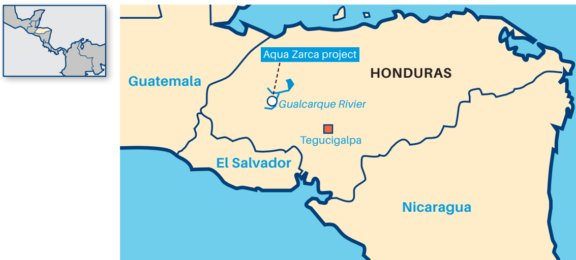
Ubicación de Agua Zarca en Honduras.

creciente conflicto violento en torno al proyecto, que llegó a ocasionar muertes de opositores locales. La compañía local continuó avanzando con el proyecto. En 2016, la destacada opositora del proyecto y líder indígena Berta Cáceres fue asesinada en su casa, convirtiendo el caso en un icono internacional de la violencia contra los defensores del medio ambiente. Al haber dejado el proyecto a tiempo, Sinohydro evitó un daño reputacional importante a su compañía y a China en consecuencia.