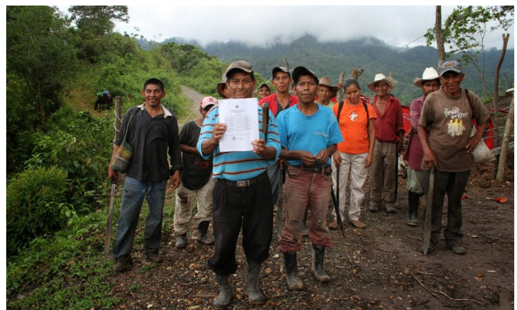
Miembros de la comunidad de Rio Blanco muestran un documento con sus firmas falsificadas de su supuesto consentimiento al proyecto.