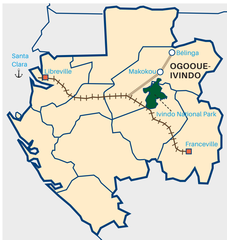
：加蓬地图，Belinga在东北部，圣克拉拉 (Santa Clara) 在西北部。

根据规划，贝林加铁矿位于加蓬东北部的一个偏远地区，由一座新大坝供电，该大坝拟建于国家公园内一处著名的瀑布上。铁矿石通过一条新铁路运送到一座新的深水港口。整个项目需要投资35亿美元，但没有进行环境影响评估，会威胁到森林、生物多样性和当地居民的生计（例如捕鱼），还会助长贪污腐败。在加蓬民间团体抗议该项目及其多方面的负面影响之后，计划资助该项目的中国进出口银行撤回了对该项目的资金支持。