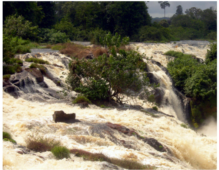
金刚 (Kongou) 瀑布。

贝林加项目预计年产3000万吨铁矿石，需要对基础设施进行大量投资：矿山位于加蓬内陆数百公里深处的一个雨林覆盖区，没有关键基础设施可供该项目使用。需要建造从Belinga到Santa Clara的总长度为560公里的铁路和Santa Clara海港，并新建两座大坝为矿山供电：一座位于伊温多 (Ivindo) 国家公园著名的金刚 (Kongou) 瀑布上，发电量为50MW；另一座位于加蓬南部弗朗斯维尔 (Franceville) 附近的大布巴哈 (Grand Poubara)，发电量为160MW。该项目总投资为35亿美元。由合资公司贝林加矿业公司 (COMIBEL) 负责开发，中国机械设备工程股份有限公司持有该公司75%的股份，剩余股份由加蓬国家政府和攀枝花钢铁集团共同持有。该矿山将由该项目的主承包商中国机械设备工程股份有限公司运营。加蓬政府预计该项目将创造3万个直接和间接工作岗位。