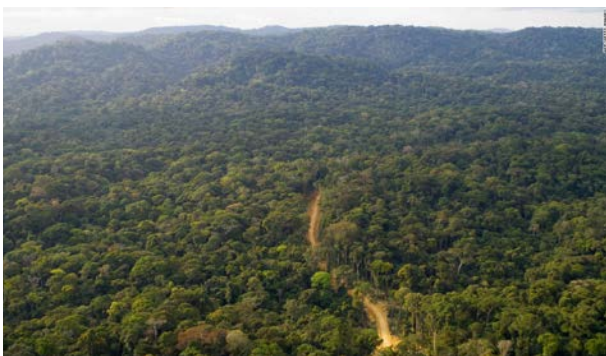
加蓬雨林。

任何项目的建设只能在获得所有必需的许可（包括环境许可）后才能开始。尤其是当项目位于重要的具备生物多样性特征的地区（例如本案例中的国家公园）内时。中国大使馆应该监督中国公司在项目所在国的活动，并在必要时提醒他们履行法律义务。