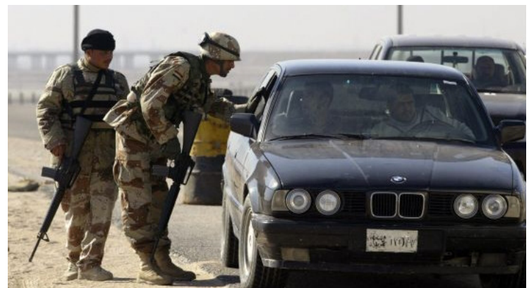
鲁 拉油田附近的检查站。