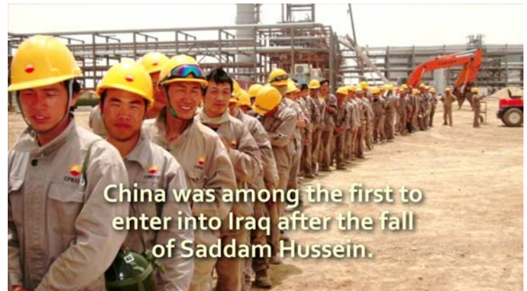
在伊拉克的中国石油工人。

阿赫代布油田建设项目是伊拉克战争后首个由中国石油天然气集团公司和伊拉克北方石油公司共同开发的新建项目，由中石油作为运营商。中国石油为该项目建立了多利益相关方参与的机制，并建立了项目层面的社区贡献委员会，服务于当地人民。截至2016年底，伊拉克正在建设几个年投资100万美元的项目。中国石油天然气集团公司积极参与改善伊拉克采掘业透明度行动计划框架内石油部门的信息披露指南，并确保纳入阿赫代布油田的石油生产详细信息，该公司持有油田50%的股权。尽管该公司因其活动处于生产的早期阶段，并且该公司尚未向伊拉克政府支付实物款项而被免除了披露要求。