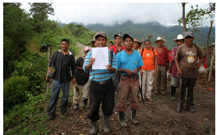
来自白河社区的成员，他们展示了伪造了他们所谓的同意项目的签名文件。