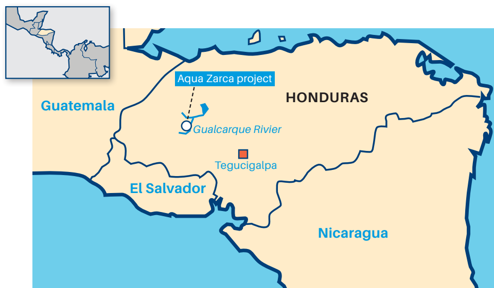
阿瓜·萨尔卡(Agua Zarca)在洪都拉斯的位置。

目周围的暴力冲突增加，包括当地反对者的死亡，中国水电退出该项目。由当地公司继续推进该项目。2016年，该项目的主要反对者、原住民领导人贝塔卡塞雷斯（Berta Cáceres）在她的家中被谋杀，该案件升级为暴力应对环境维护者的国际性事件。通过及时退出项目，中国水电避免了对公司和中国的重大声誉损害。