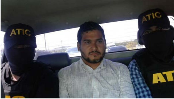
2018年3月，负责该项目的洪都拉斯公司DESA的首席执行官被拘留。